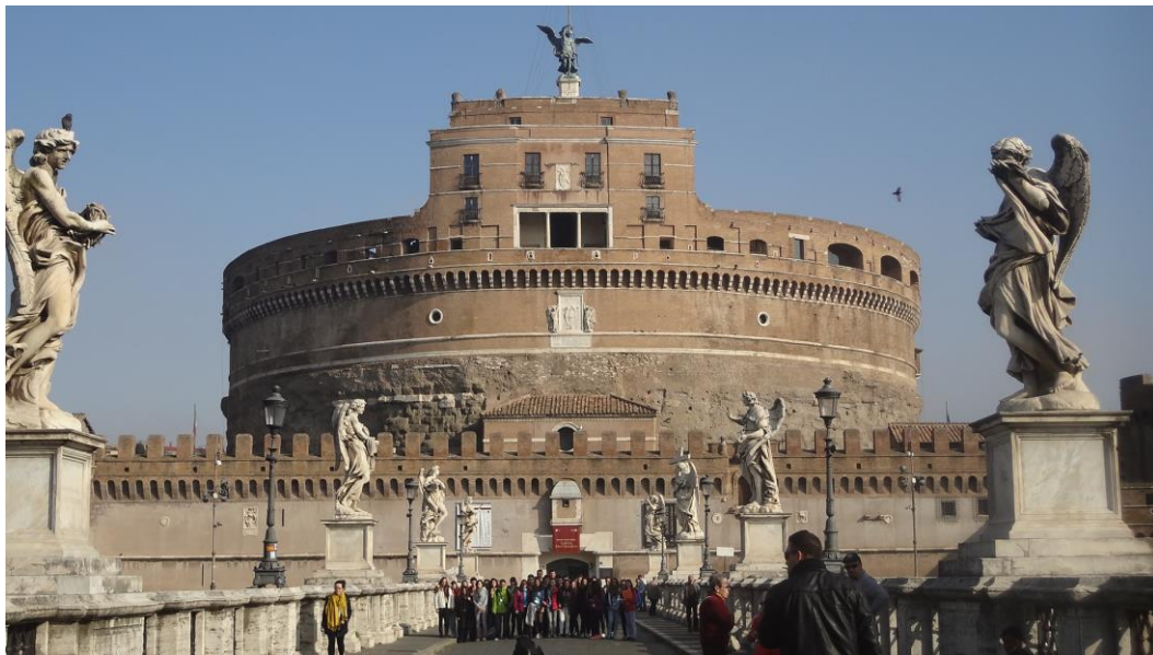
トスカの舞台ローマ